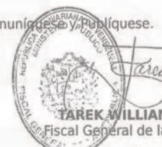
TAREK WILLIAMS SAAB Fiscal General de la República