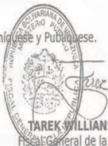
TAREK WILLIAMS SAAB Fiscal General de la República