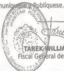
TAREK WILLIAMS SAAB Fiscal General de la República