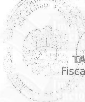
TAREK WILLIAMS SAAB Fiscal General de la República